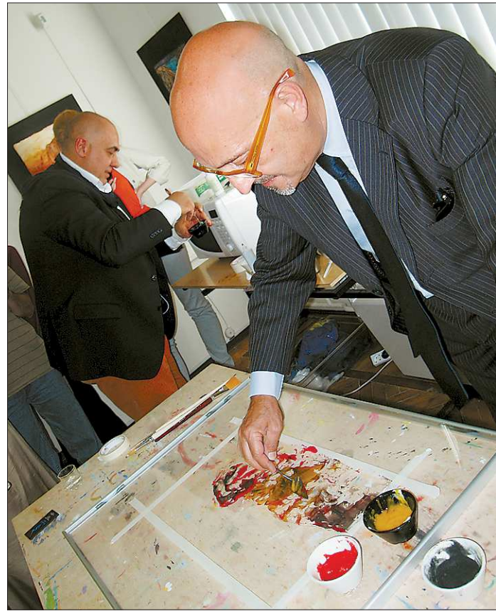
Картина маслом. Шоколадным