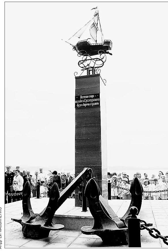
Парящий над Исетью корабль «Во славу флота России»

К вечеру подставные гости праздника собрались на городскую площадь, где для них было приготовлено юбилейное шоу. Пришли на концерт целыми семьями. Старшее поколение по достоинству оценило духовой оркестр, расположенный недалеко от главной сцены, а также танцевальную площадку для незабвенной польки, кадрили, вальса... Поздравить среднеуральцев приехали представители администрации из Бисерти, а из Верхней Пышмы прибыла целая делегация маленьких артистов. Дети прочитали поэму, посвящённую Среднеуральску, в которой назвали этот город «маленькой Швейцарией». И, конечно, не остались без внимания семейные традиции, которым