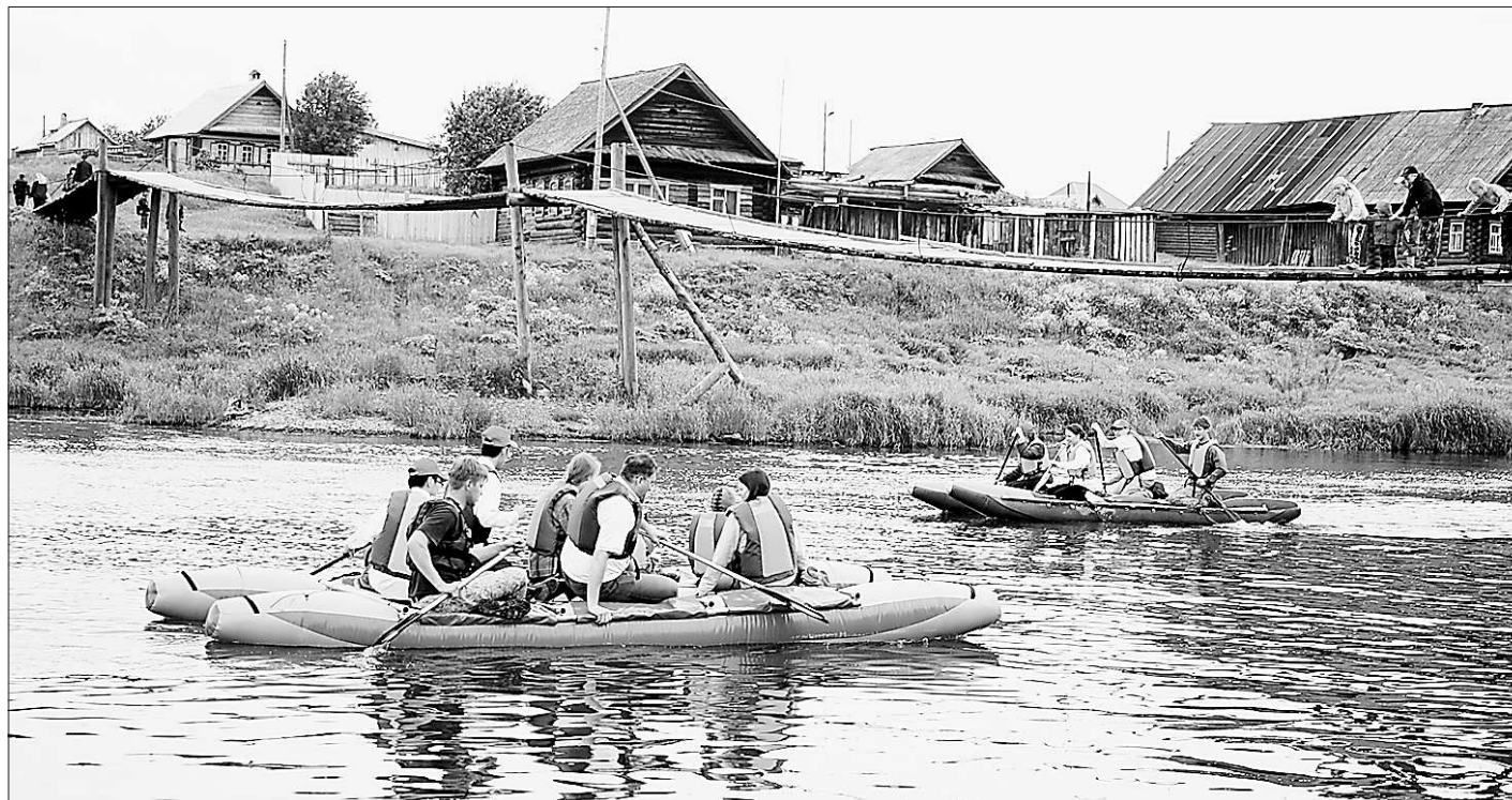
Караван XXI века