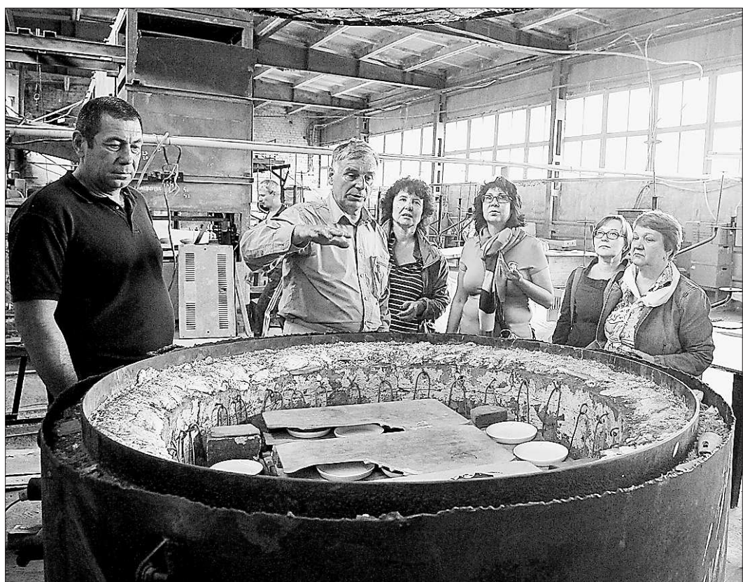
Когда б вы знали, из чего делаются шедевры...

В Невьянске в программу развития туризма включили не только город, но и потенциально привлекательные окрестности: памятники природы – озёра Аяцкое и Таватуй, уникальный проект конгрессной деревни в посёлке Ребристый и Тавола. Программа