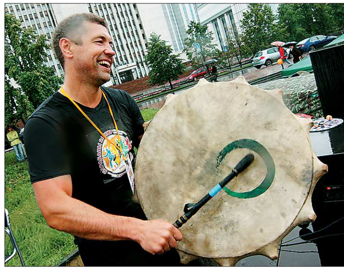
Пульс планеты уже прощупывается

В субботу под почти непрекращающимся дождем на площади около Театра драмы почти триста уральцев участвовали в ритуальном ритмическом часовом действе. Из-за непогоды установить телестелост с дру-