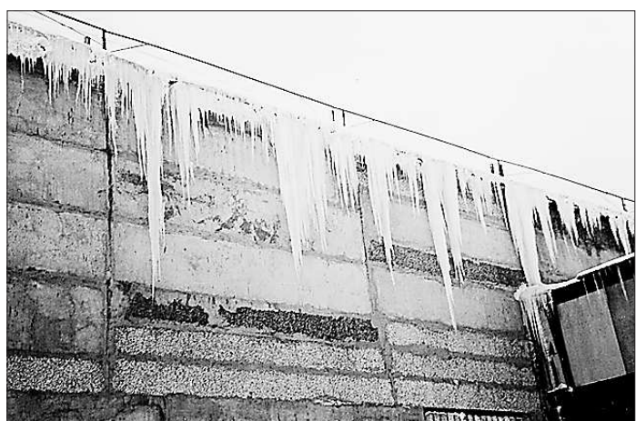
Мягкая кровля до ремонта

Наиболее безопасные и самые дешёвые — шиферные кровли. За счёт волнового профиля листа обеспечивается хорошая естественная вентиляция подкровельного пространства. Высокое термосопротивление шифера (в 100 раз больше, чем у металла)