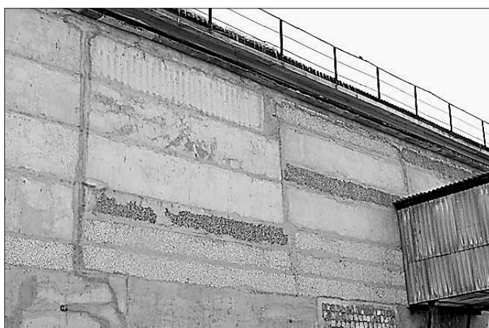
Отремонтированная кровля с применением шифера

Самыми дорогостоящими и опасными по льдообразованию являются металлические (металлочерепичные) кровли из-за их высокой теплопроводности. Необходимо мощное утепление и вентиляция чердака, между металлочерепицей и обрешёткой должен быть специальный утеплитель, от снега лавиной устанавливаются снегозадержатели, от шума дождевых капель — хорошая звукоизоляция и т. д. По большому счёту, метал-