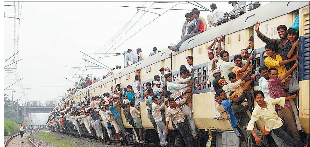
В отличие от индийских электричек, в наших места ещё есть

Подробности о работе уральской делегации на Петербургском экономическом форуме читайте на 4-й странице.