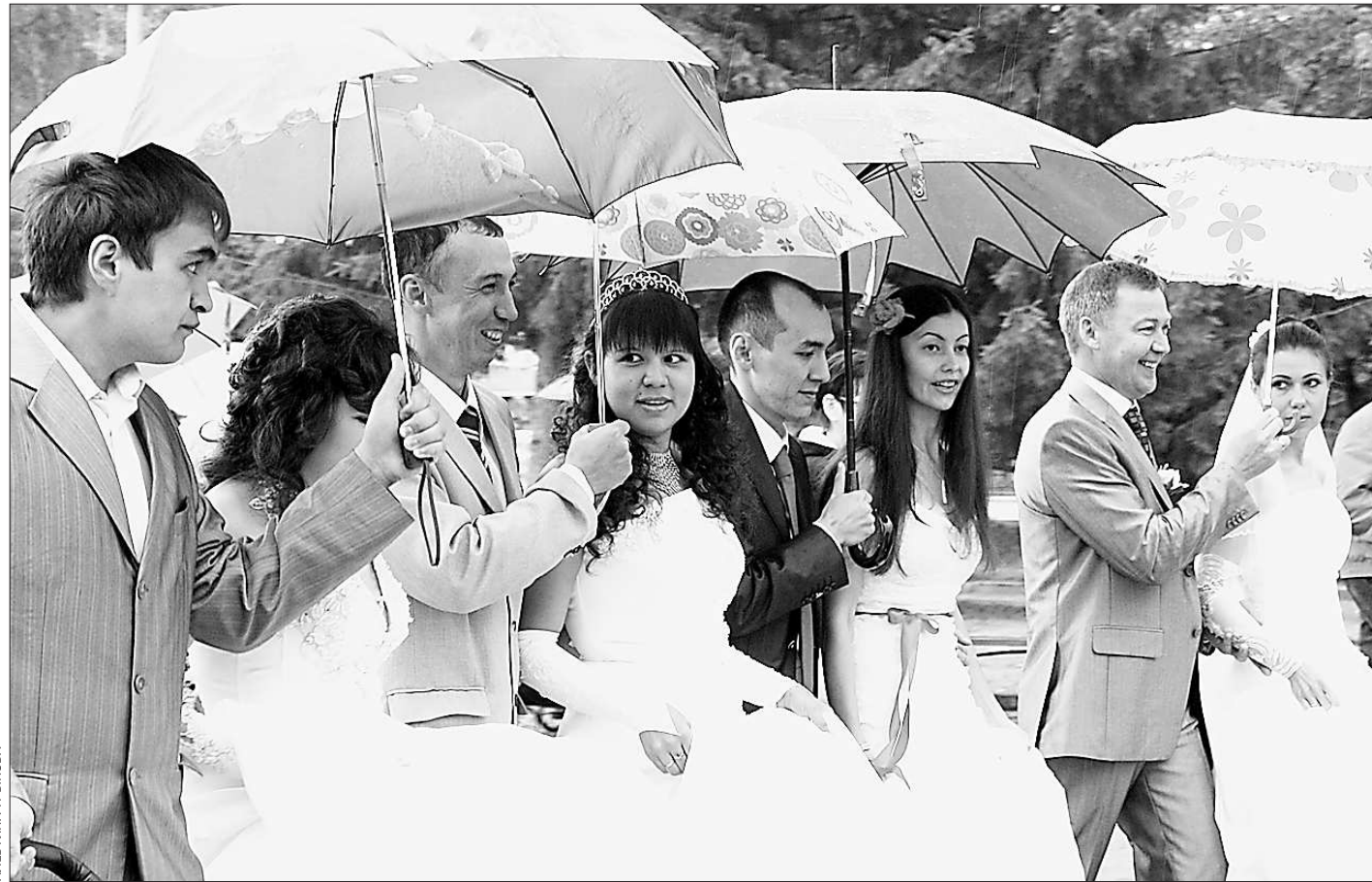
Кто делает погоду в доме? Участники конкурса «Супер-невестка» и их мужья готовы встретить любую напасть с улыбкой

В будущем «Красная линия» обрстет не только сопутствующими рисунками, но и аудиогидом. Она появится на некоторых картах и уже в июле будет предложена в качестве маршрута для гостей «Иннопрома».