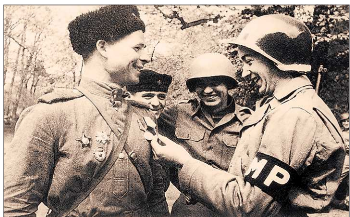
Встреча советских и американских войск на Эльбе. Мы этой памяти верны

№ 220-222 (5773-5775). Цена в розницу — свободная.