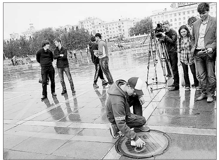
Художник коллектива «Стенография» делает завершающие штрихи к линии