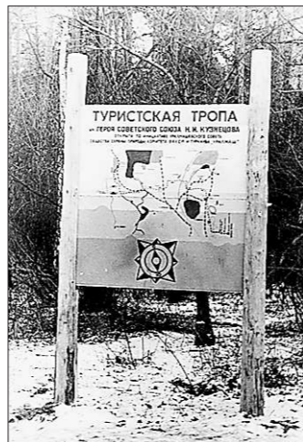
Указатель на тропе: с пути не собьёшься

Тропа начинается на Уралмаше у памятника Николаю Кузнецову (в конце бульвара Культуры).