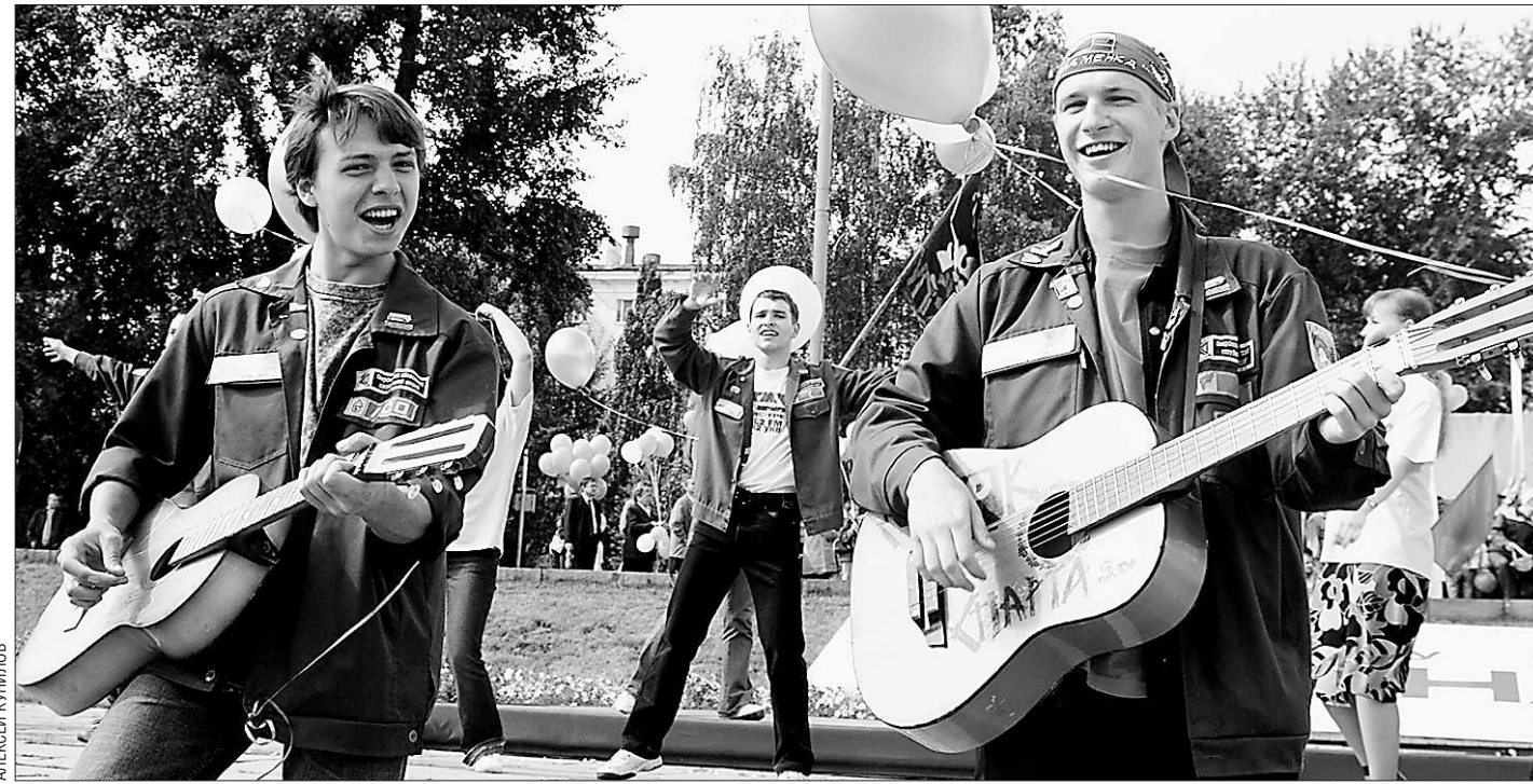
Стройотряды – это юность, романтика и верные друзья

Кстати, работы по ликвидации «эха войны» уже велись. Занималось этим региональное министерство природных ресурсов. Однако в короткие сроки не удалось: мероприятия по захоронению (утилизации) боеприпасов и рекультивации земель требуют больших финансовых затрат. В связи с этим правительство области разработало на ближайшее время план первоочередных мероприятий. Основные из них – мониторинг ситуации на полигоне, охрана территории и предотвращение на неё несанкционированного доступа посторонних лиц. Для этого планируется в ближайшее время отгородить полигон забором и создать пост охраны. Таким образом, опасность для местных жителей будет полностью предотвращена. Не сможет на заражённую территорию проникать и скот, что раньше тоже случалось.