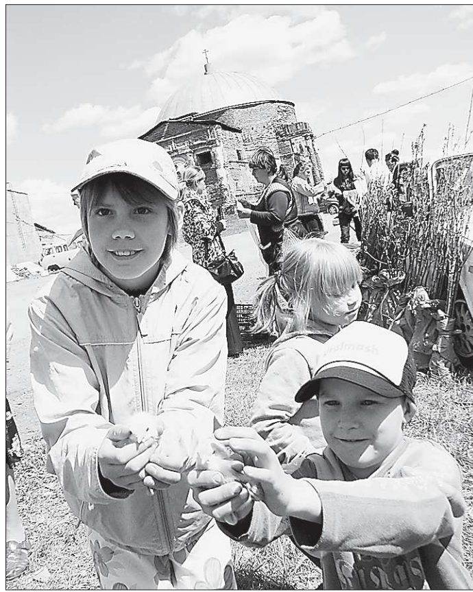
На сельской ярмарке постояльцы детского приюта Кленовского не отходили от цыплят

На организации праздника миссия православного прихода не закончилась. Социальная помощь немощным старикам, воспитание детей, озеленение территории, разбивка кленовой рощи, обустройство спортивной площадки, борьба с наркоманией и пьянством. «Не для галочки мы этим занимаемся, – на бегу оправдывались певчие православного прихода села Кленовского. – Так надо». Сказали и дальше побежали – кто грядки поливать, кто посуду в трапезной мыть. Гости на праздник съехались много.