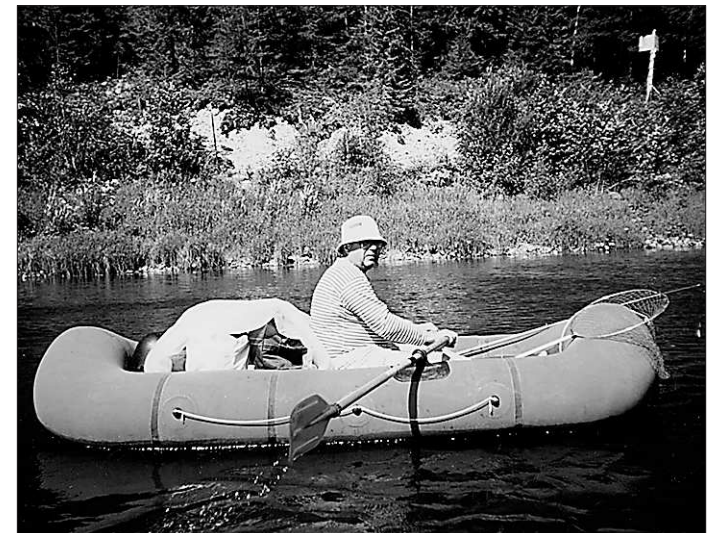
В числе увлечений — охота, рыбалка и сплавы по реке Чусовой