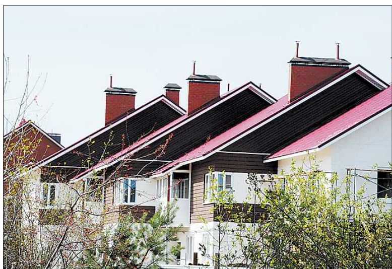
Таунхаузы щеголяют новыми крышами

— Это вторая демонстрационная площадка «Иннопрома-2011», — рассказал он на выездной пресс-конференции. — На ней мы покажем гостям выставки инновации в малоэтажном строительстве. Каждый из пятнадцати возводимых сейчас таунхаузов строится по какой-то особой техно-