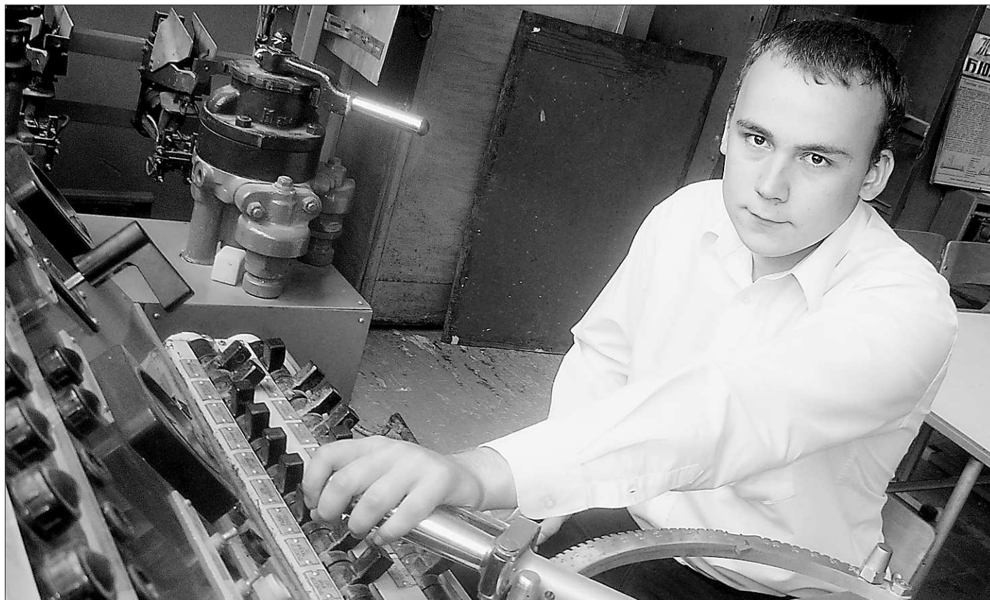
В профессионалах остро нуждаются наши заводы. Рычаги экономики — в мастерских руки!

Если к этому количеству прибавить ещё примерно сорок тысяч выпускников вузов, то ситуация выглядит вполне благополучно.