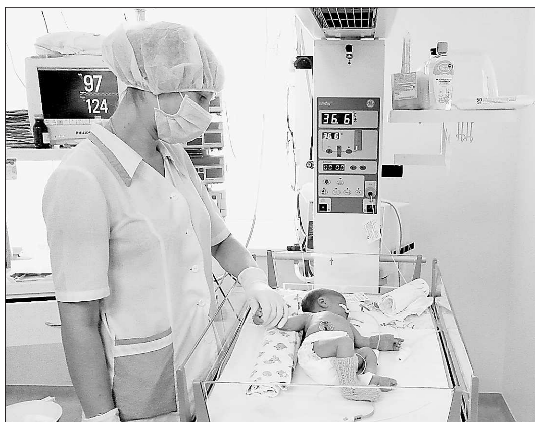
Можно утверждать, что в этом центре жизнь малышей в надёжных руках

Инициатива Президента порадовала и учёных Уральского отделения РАН. По мнению заместителя председа-