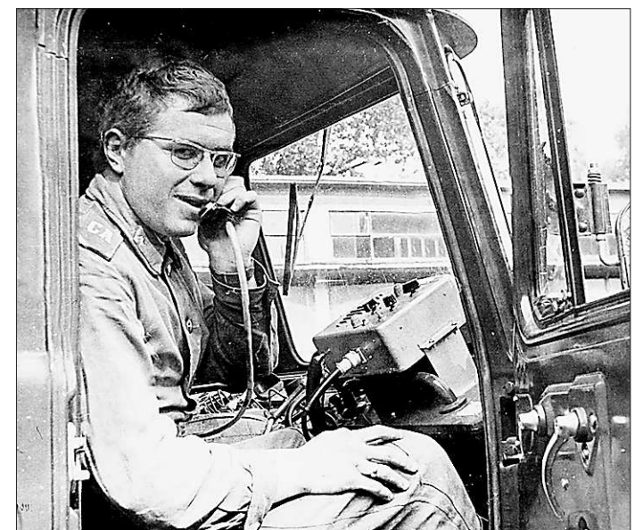
Армейскую службу проходил в Калининграде, в войсках связи

Является руководителем координационно-методического совета по совершенствованию чёрно-пёстрого скота Урала.