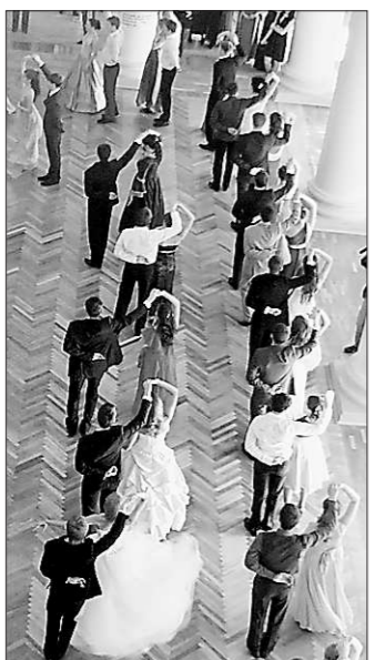
Пока у них получаются не все па, но это – вопрос времени

Между тем для того, чтобы попасть на такой бал, нужна соответствующая экипировка (организаторы тщательно проверяют «дресс-код») и танцевальные навыки. Вероятно, именно поэтому первый такой бал в УрФУ, состоявшийся в декабре прошлого года, собрал