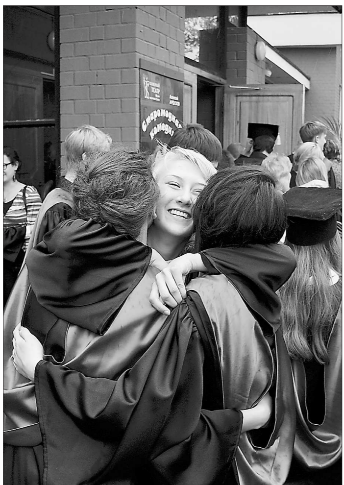
Прощание со школой вышло и радостным, и грустным: тяжело расставаться с учителями и одноклассниками...

Праздник для выпускников, родителей и учителей развернулся в екатеринбургском Камерном театре. Прощание со школой вышло и радостным, и грустным. Педагоги пели, родители шутили со сцены, младшеклассники читали выпускникам стихи, но признались, что старшим ничуть не завидуют. «У них будет ещё много диктантов