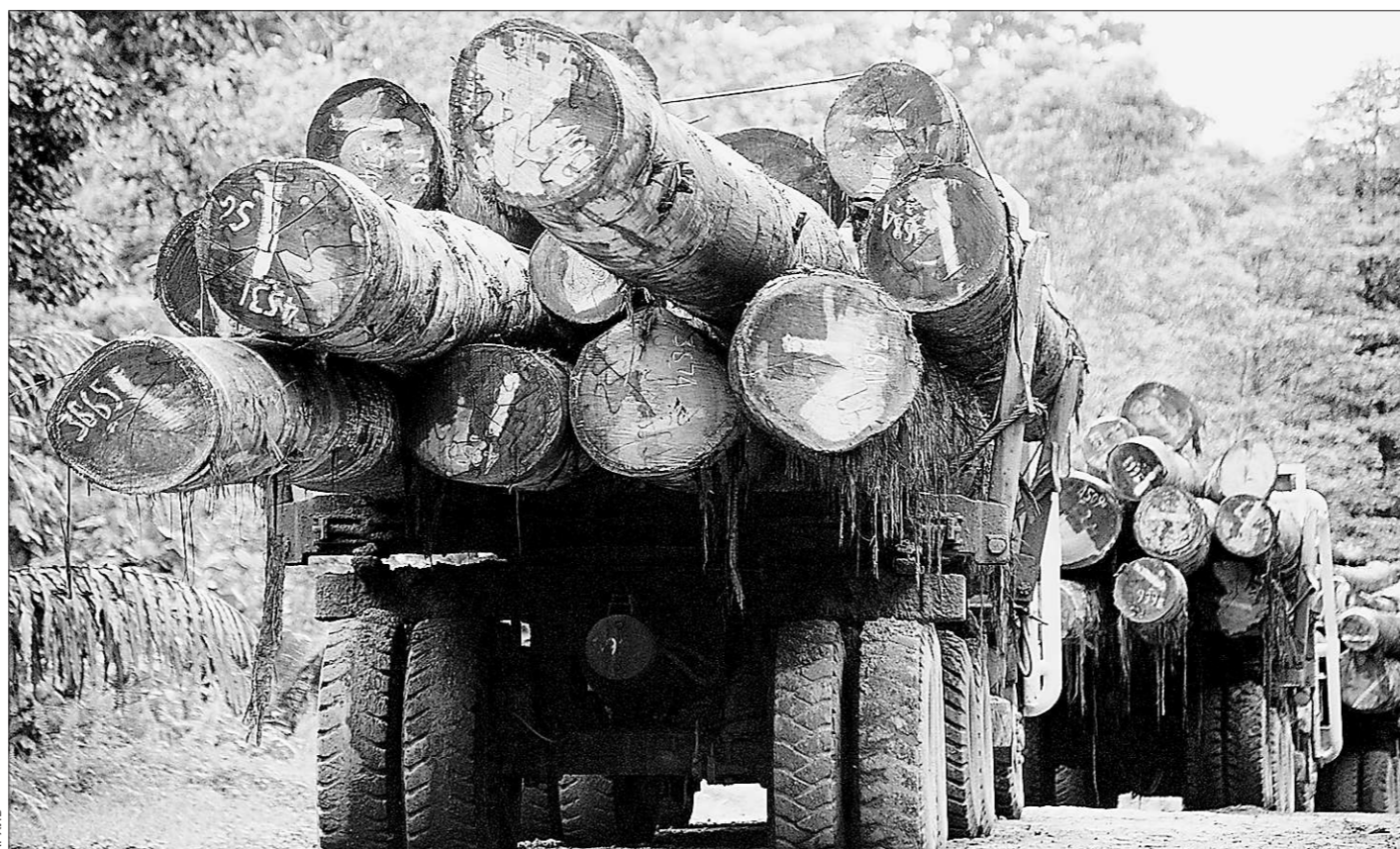
А ждут ли этот груз на станции?

Кстати, сейчас министерство финансов совместно с налоговой инспекцией прорабатывают возможные предложения по внесению изменений в бюджет на 2011 год. Когда решение будет принято, ещё не известно, но обсуждение уже идёт. А со следующего года Свердловская область переходит на трёхлетнее бюджетное планирование.