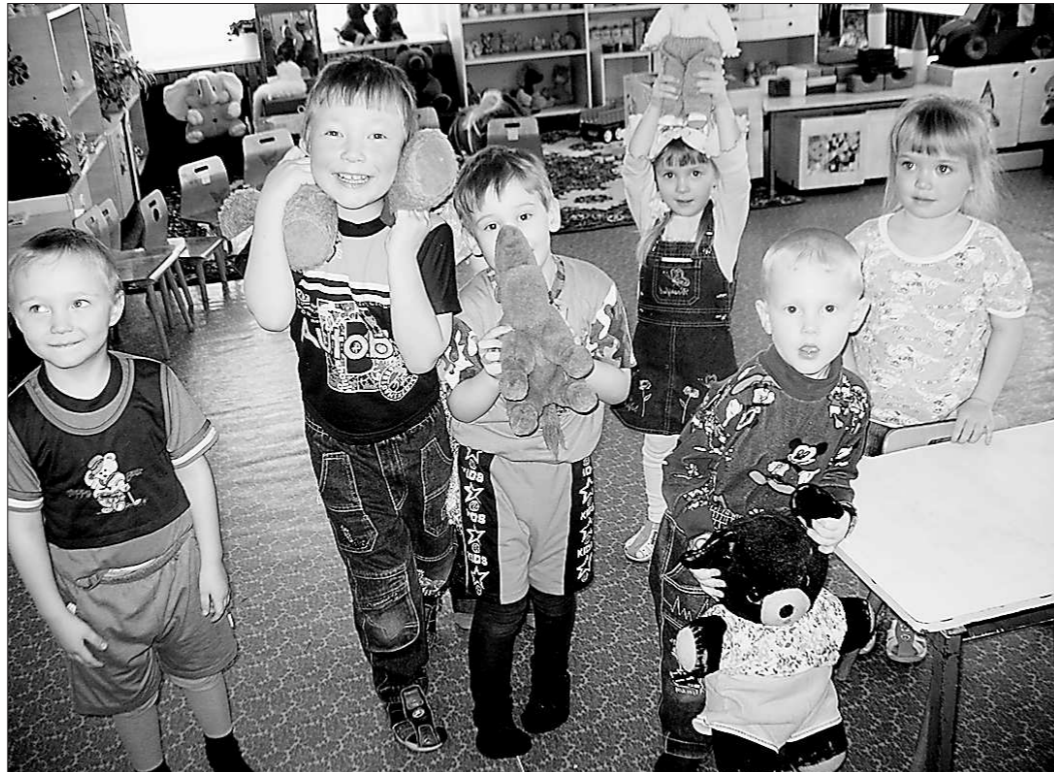
Этим ребятишкам повезло: для них есть места в детском саду

Ввод дополнительных групп и их уплотнение – это быстрые меры. Чего не ска-