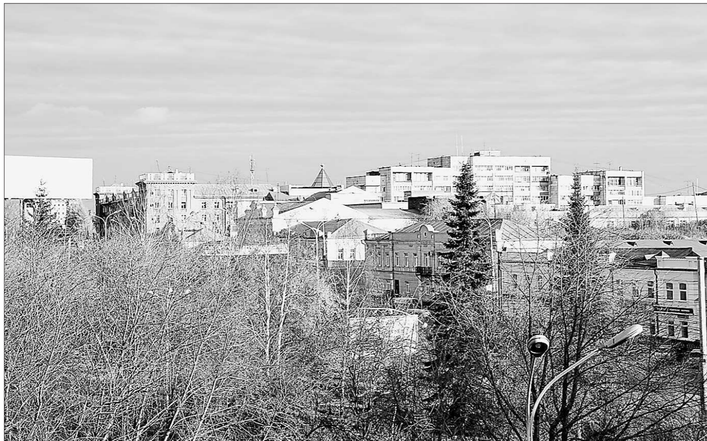
Нижний Тагил получил второе дыхание за счёт Программы поддержки моногородов