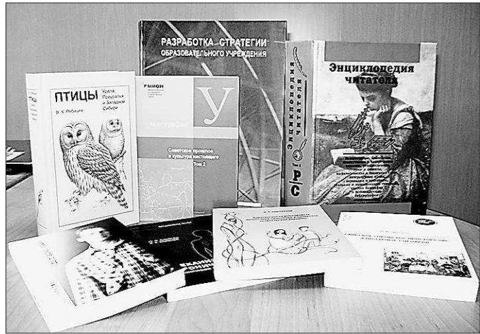
За 25 лет издательство подготовило более трёх тысяч изданий