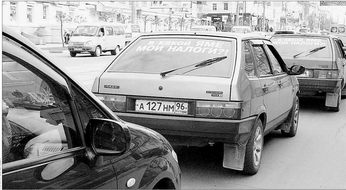
К сплошным ямам и колдобинам российским автомобилистам давно пора бы привыкнуть, а не нет – они неумолимы, продолжают искать правду

Основными структурными единицами объединённого университета станут институты. Сегодня на базе УрГУ их создано четыре – естественных наук, социальных и политических наук, гуманитарных наук и искусств, а также институт математики и компьютерных наук. Кроме того, на базе экономического факультета УрГУ, факультета экономики и управления УрФУ и бизнес-школы УрФУ создана Высшая школа экономики и менеджмента.