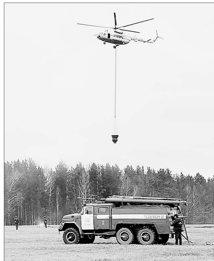
Для борьбы с огнём у нас есть всё, кроме дисциплины

Как известно, правительство Свердловской области продлило ограничение доступа населения в леса Среднего Урала до 17 мая. В региональном кабинете министров действует штаб, который в круглосуточном режиме координирует работу всех структур, ответственных за борьбу с лесными пожарами. Но ситуация остаётся тревожной: за последнюю неделю, несмотря на введение особого противопожарного режима, зарегистрировано на 12 процентов больше природных пожаров, чем за аналогичный период прошлого года.