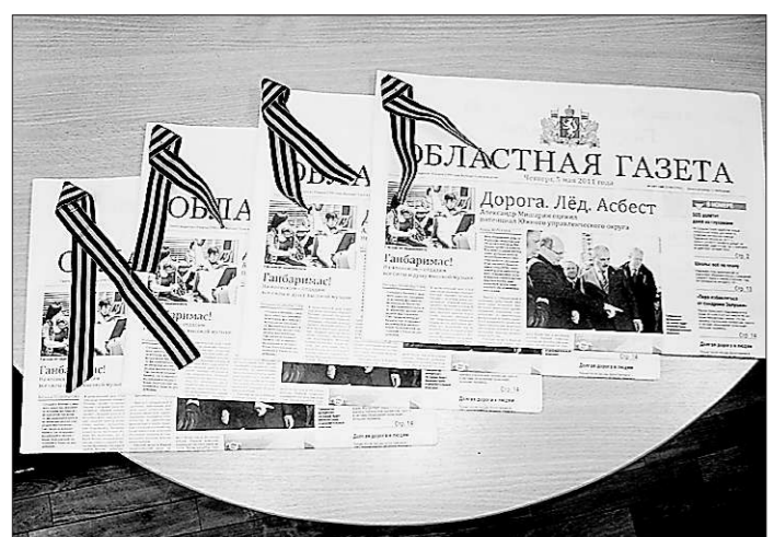
Так выглядел номер «Областной газеты» за 5 мая