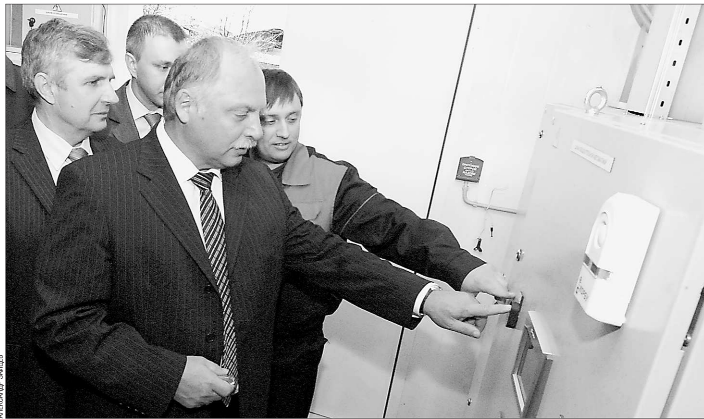
Тепло Новой Ляле гарантировано

Прописаны в новом законе и юридические аспекты по вопросам конфискации имущества коррупционеров. Также вводится материальная ответственность для посредников, которые передают взятку. Наказаны рублём будут все. Осталось их только переловить.