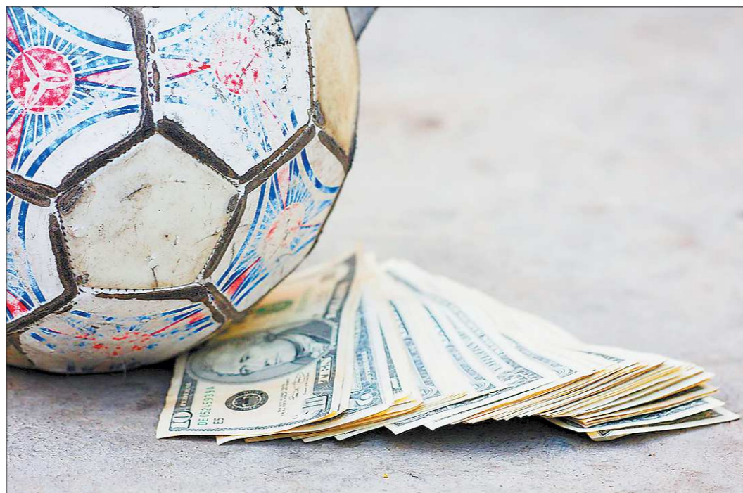
Гигантские финансовые вложения в российский футбол не смогли поднять его качество.

Но сборная – это российские футболисты. Понятие «русский футбол» ныне значительно шире. Оно включает в себя и наши клубы, лучшие из которых укомплектованы россиянами лишь наполовину. Именно их неудачи и заставляют задуматься о некоем системном кризисе в вопросах управления нашим футболом. Финансовые вложения в этот вид спорта непрерывно растут, за короткий срок увеличиваясь в разы. По данным экспертов журнала «Финанс», совокупный бюджет клубов российской премьер-лиги в прошлом году составил 558 миллионов долларов, а нынче – уже 947! Наибольший прирост среди клубов первой пятерки зафиксирован у «Рубина» (+118%), ЦСКА (66) и «Зенита» (60). Лидер по абсолютным цифрам, «Зенит» на 2011 год имеет бюджет в 165 миллионов долларов, что в два с половиной раза превышает таковой у дортмунд-