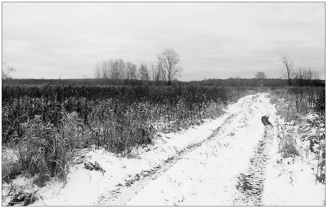
Рынок земли у нас ещё не сформировался, но путь к нему уже намечен.