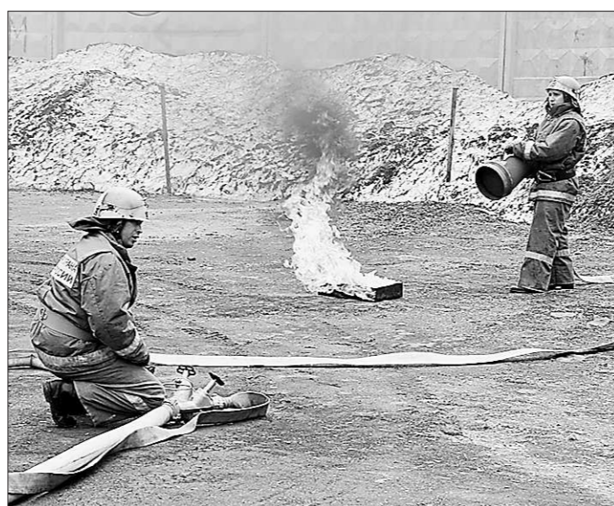
Огнеборцы победили учебную стихию в считанные секунды.