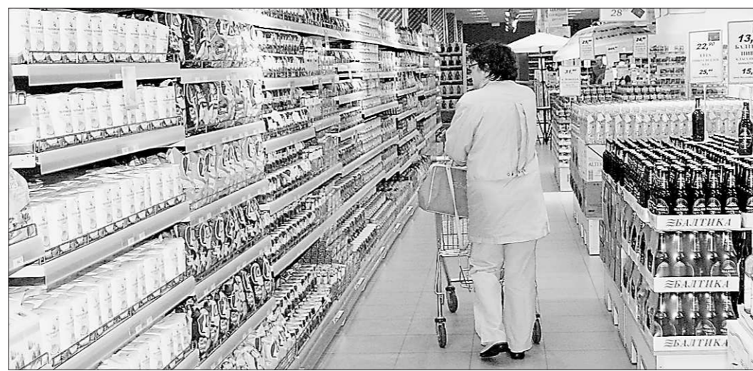
Идёт невидимая битва за покупателя, но в его ли интересах?

—Ряд производителей в хлебопекарной отрасли области закончили 2010 год с убытками, рентабельность отрасли в целом составляет менее одного процента. А в это время торговые сети открывают всё новые