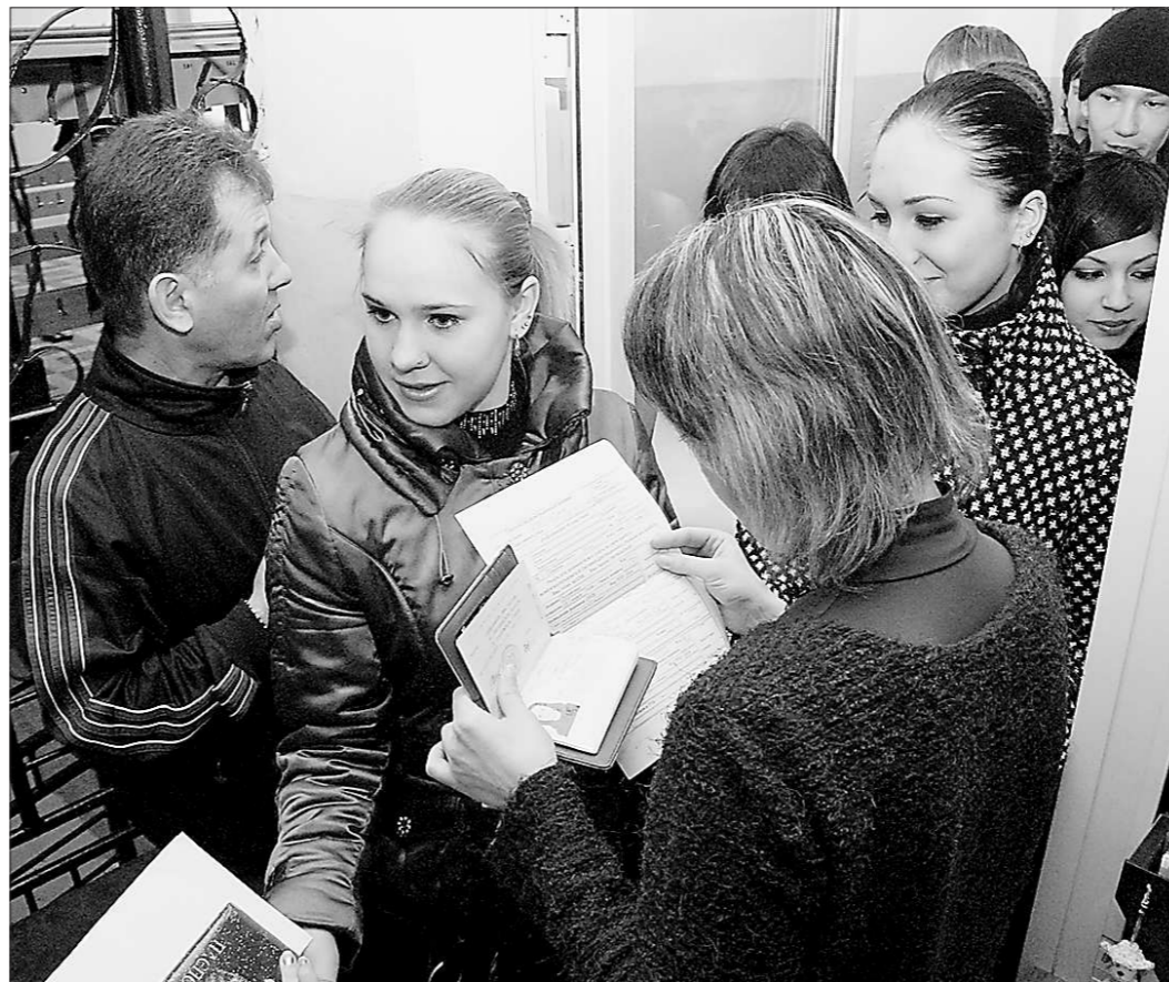
Собираясь на ЕГЭ, мобильный телефон лучше оставить дома, а вот паспорт обязательно взять с собой.

В этом году решено серьёзнее следить и за соблюдением прав выпускников на экзамене. О нарушениях и доставленных неудобствах они должны сообщить общественному наблюдателю до выхода из пункта проведения экзамена. Замечания выпускника могут касаться не только очевидных нарушений, таких, как бракованный бланк или недостаточный инструктаж, ребёнок может высказать недовольство по поводу того, что во время экзамена громко хлопали форточкой или дверью, тем самым заставляя его отвлекаться. Общественный наблюдатель обязан будет направить эту информацию в государствен-