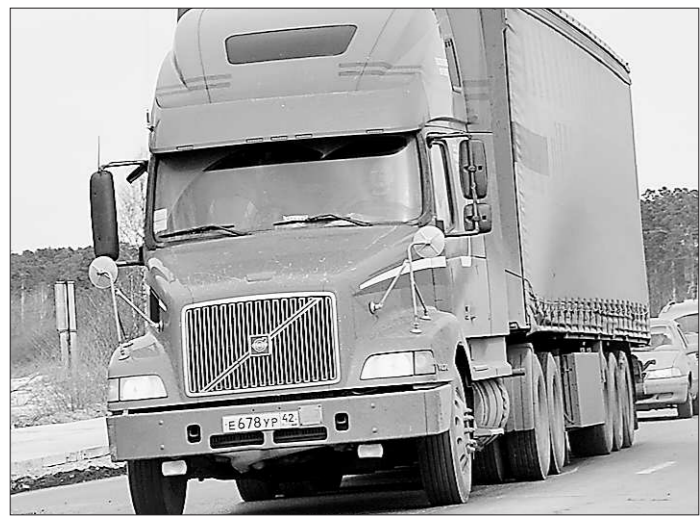
Дорог нынче «овёс» для железных коней.