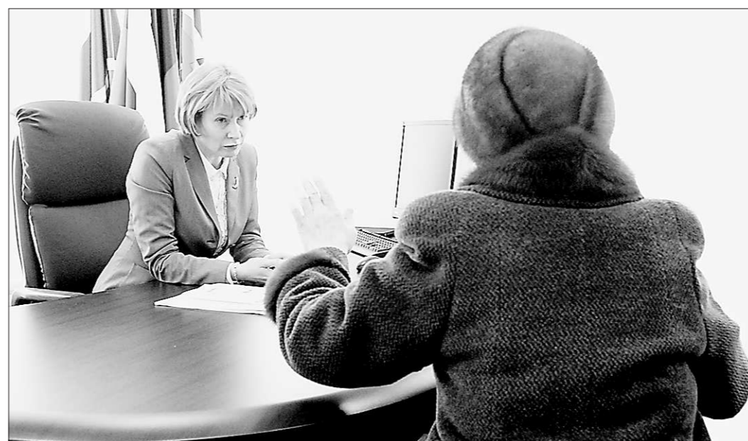
«Подсказки» как изменить закон депутаты «единороссы» часто находят во время встреч с жителями.

«Спасибо! ...Как ни странно, большинство вопросов жителей области касались именно пенсионного обеспечения. Один за другим посетители приёмной сетовали