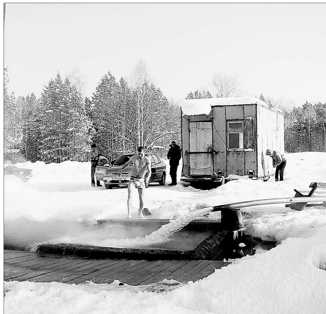
«Родничок» никого не пустует.