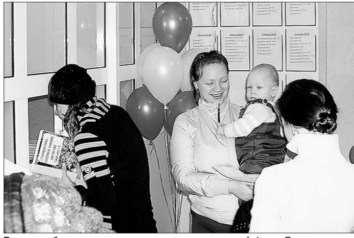
В новую больницу – с хорошим настроением!