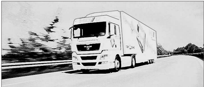
Так выглядит ПТС XXI века