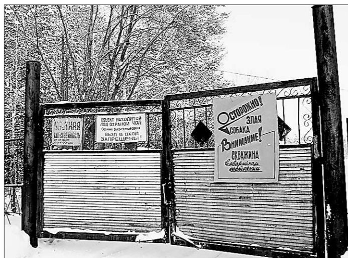
Даже «угрожающие ворота» никого не останавливают.

Между тем люди, нуждающиеся в лечении, профилактике болезней и просто отдыхе возле уникального источника, ехали сюда отовсюду. Просили, умоляли охрану допустить их к воде. И сторожа (то ли из личной выгоды, то ли по подказке сверху) сделали-таки милость. «Смастерили» в металлическом заборе лаз, убрав из него несколько стальных прутьев. Пройти через него можно только в полусогнутом состоянии. Капитка же заперта. А кто пожелает подъехать к самому родничку, ворота откроют, но за денежку. Так про-