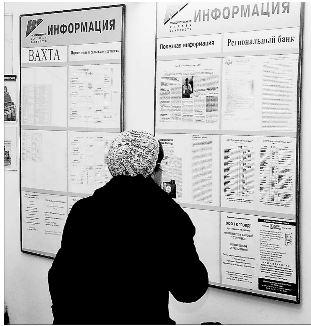
Три года назад безработица беспокоила меньше трети россиян, а сейчас, по данным социологов, их число выросло в полтора раза.

Другой системный вызов в сфере занятости – это ситуация в моногородах, в кото-