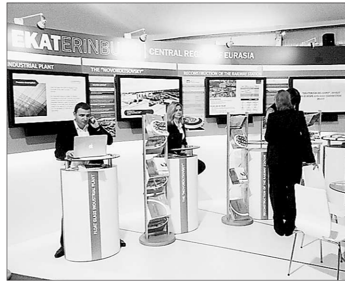
«EKATERINBURG Central region of Eurasia» – под таким именем знают Свердловскую область в Европе.

Стенд Свердловской области в Каннах назывался «EKATERINBURG Central