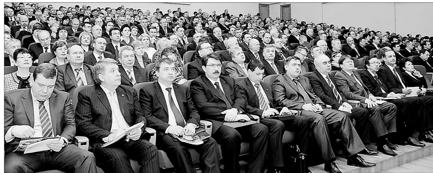
Задачи, которые предстоит решить в первую очередь, министры областного правительства берут на карандаш.

Де-факто работа над ним ведётся, изучается опыт других субъектов, где подобный закон уже действует.