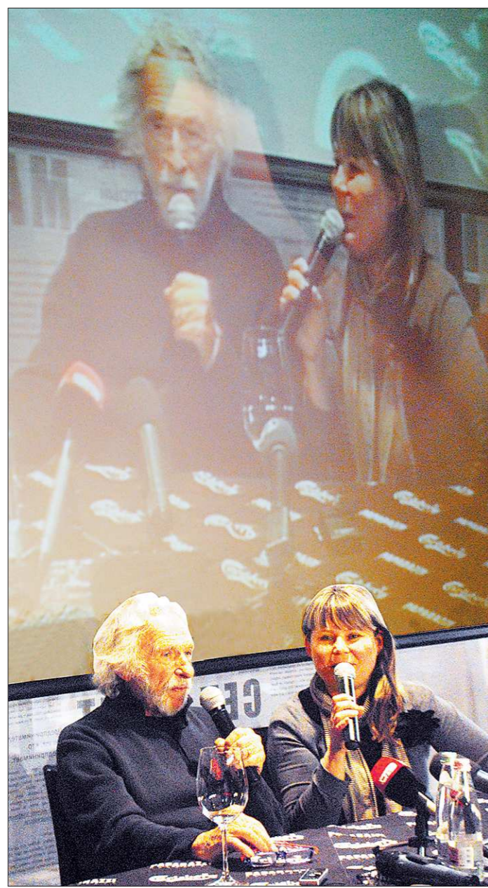
Говорят, он по-прежнему боится журналистов.

Знаменитый французский актёр снова в Екатеринбурге