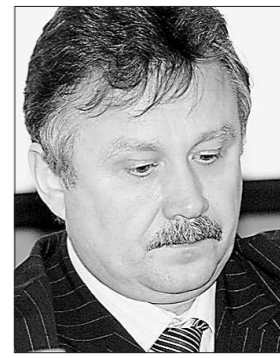
Михаил Зацепин.