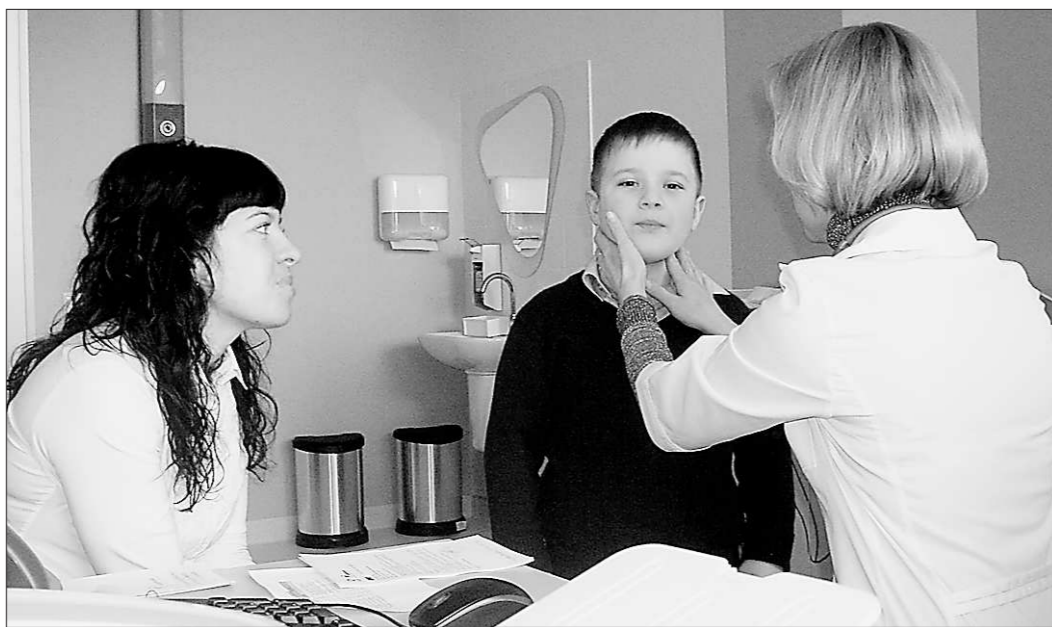
Обследование в детской поликлинике «УГМК-Здоровье». Одними из первых её пациентов стали дети, чьи родители служат на подводном крейсере «Екатеринбург».