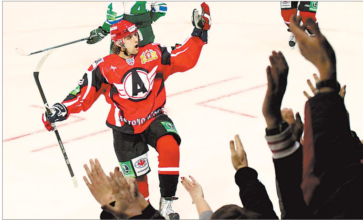
Продолжится ли хоккейный праздник?

Надрывная хрипотца Высоцкого, нерв и бесхитрость его песен покорила не только десятилетия назад. Его мысли и сегодня остаются актуальными и продолжают покорять. А потому – полёт не прерван. Полёт продолжается.