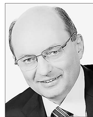
Губернатор Свердловской области Александр Мишарин:

В эти дни мы отмечаем 80 лет со дня рождения Бориса Николаевича Ельцина. Мы с гордостью можем сказать, что Свердловская область — не только место рождения выдающегося государственного деятеля XX века, но и та земля, где сформировалась его лидерская натура, настоящий уральский характер — крепкий, пробивной, напористый.