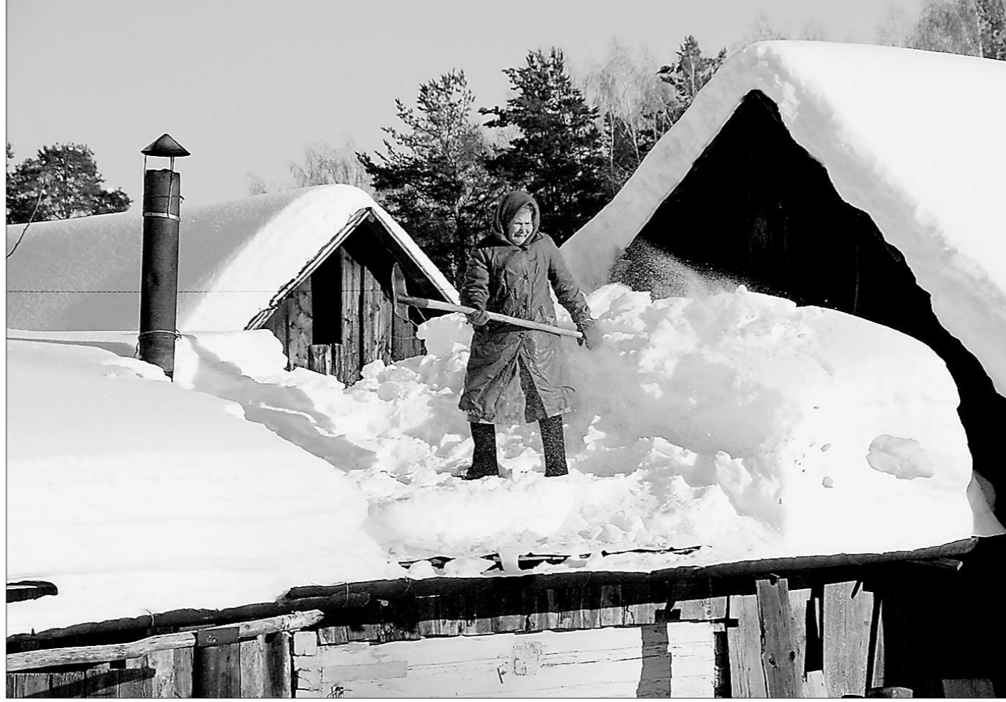
С лопатой – аж на крышу.

Сегодня техника кооператива «Завет Ильича» активно работает на уборке снежных заносов во всех деревнях бердюгинской административной территории.