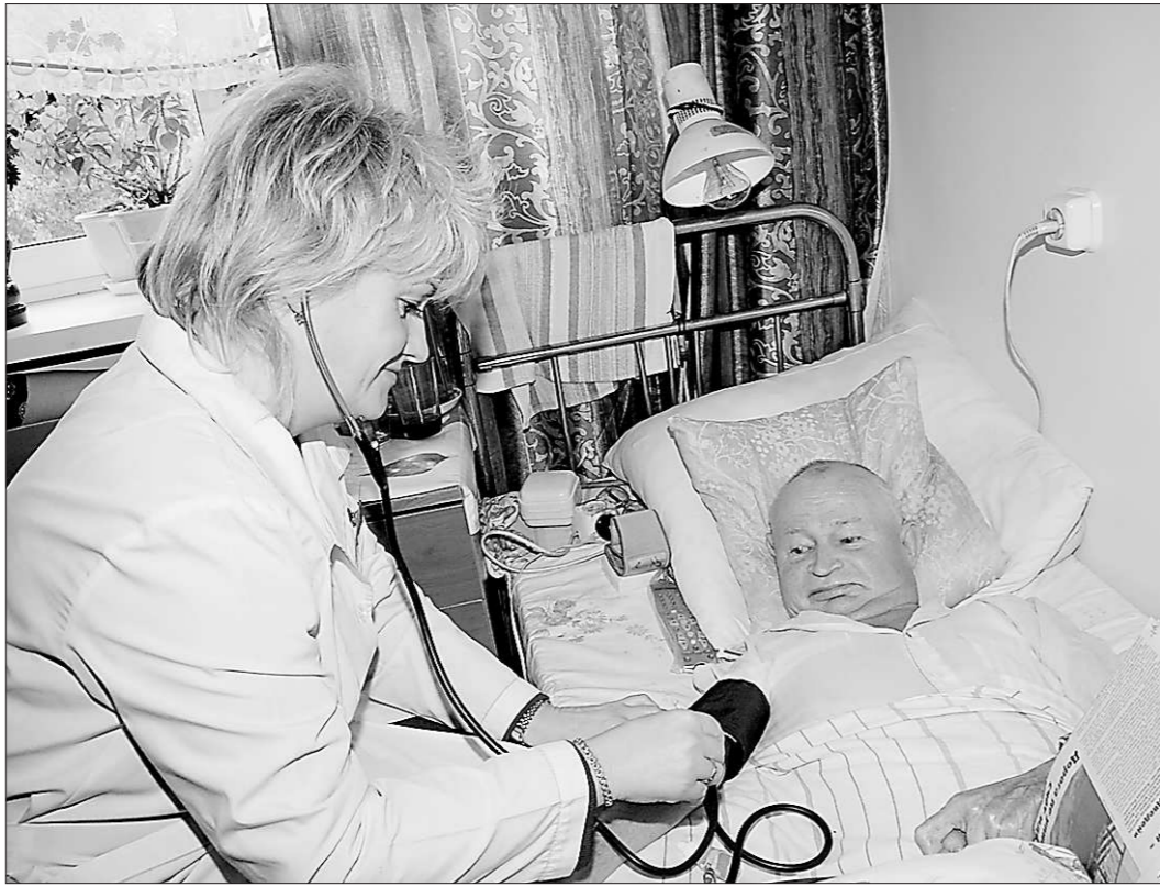
Нижний Тагил. Пансионат для ветеранов.

Пенсии последние годы растут, поднимаются они и в 2011 году. Что касается ветеранов Великой Отечественной войны, то они получают ежемесячно до 23 тысяч ру-