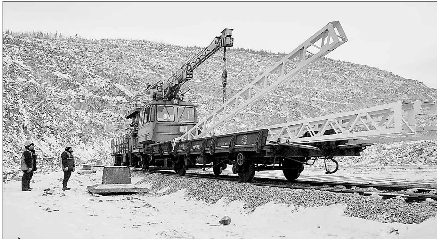
В карьере Качканарского горно-обогатительного комбината идёт строительство инфраструктуры.