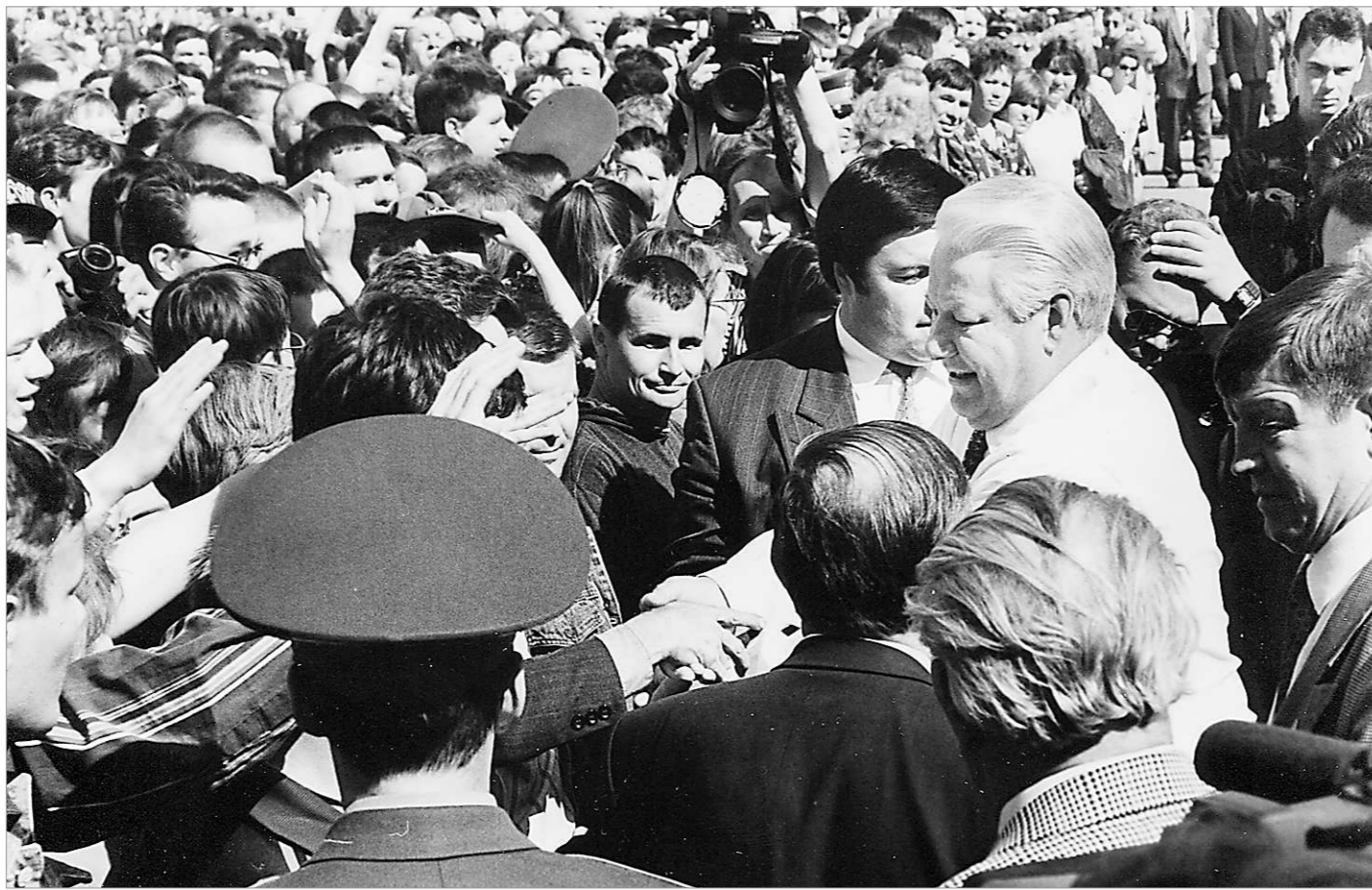
Б.Ельцин с избирателями. Екатеринбург, 1996 год.