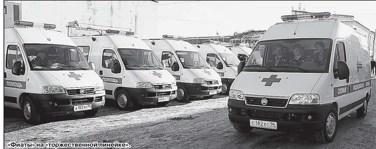
«Фиаты» на торжественной линейке.

Чтобы укомплектовать десять новых бригад, станция «скорой по-