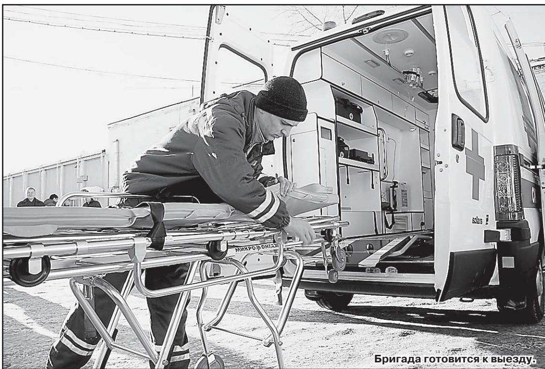
Бригада готовится к выезду.

мощи» приняла на работу более ста фельдшеров, 50 санитаров, 48 водителей. Все экипажи равно-