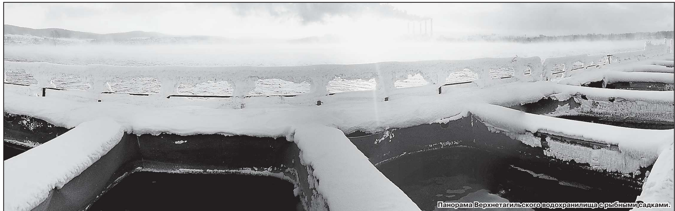
Панорама Верхнетагильского водохранилища с рыбными садками.

«Прямая линия» состоится 18 января с 15 до 17 часов. Звоните по телефонам: —355-26-67 (для жителей Екатеринбурга); —262-63-12 (для жителей области). Ждём ваших звонков.