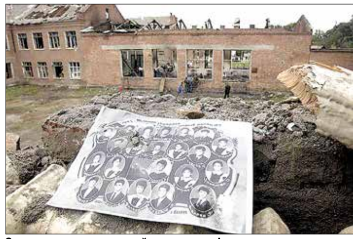
Один из снимков, который покажут на фотозаставке в школах региона.

НЕ ЗАТЯГИВАТЬ до последнего дня подачи заявки. Нужно успеть заявиться до 29 сентября.