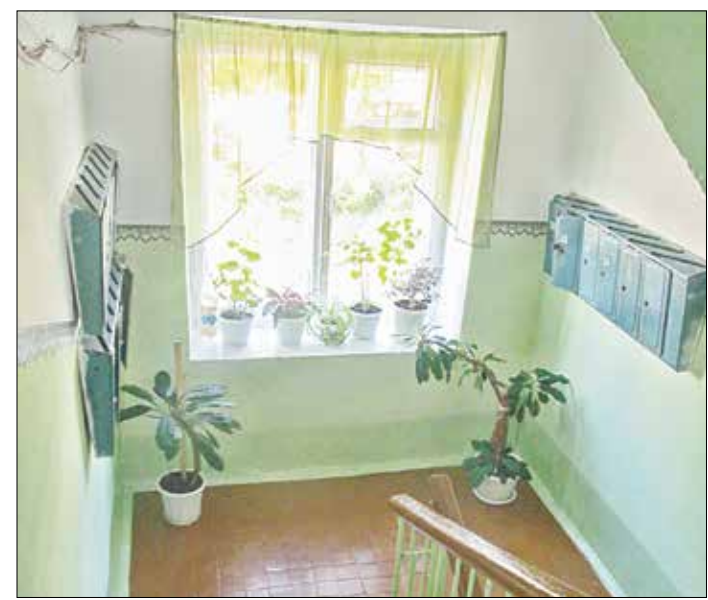
На окно повесили шторы, поставили комнатные цветы – получилось по-домашнему уютно и красиво