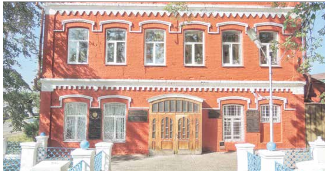
Старинное здание заводоуправления до сих пор одно из самых запоминающихся в городе

– На завершающий этап вышли две программы технического перевооружения предприятия. Это модернизация кузнечно-прессового цеха и реконструкция корпуса механического цеха. Техническое перевооружение участка штамповки заго-