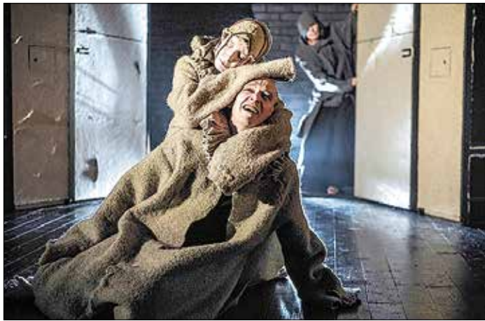
На фестивале представлена также классика, но в новом прочтении. Одна из таких постановок — «Король Лир» Театра-студии «Грань» из Новокузнецка

Через неделю, 8 сентября, в Екатеринбурге начнется XIV Всероссийский фестиваль «Реальный театр». За восемь дней на разных театральных площадках города будет представлено 22 спектакля 18-ти театров и творческих объединений из Екатеринбурга, Омска, Новосибирска, Москвы, Санкт-Петербурга, Ярославля, Казани, Минусинска, Серова, Кирова и Таллины и других городов.