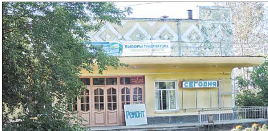
Кинотеатр запустят осенью этого года

В реализации намеченных планов нам помогают ГК «Ростех», региональное министерство науки. Верю, что мы общими усилиями построим новое высокотехнологичное производство.