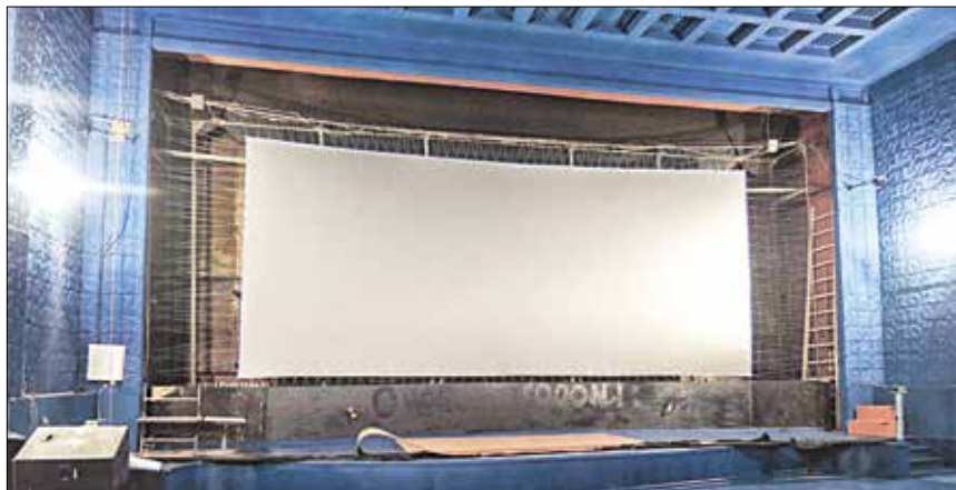
Это будет самый большой экран среди кинотеатров близлежащих городов