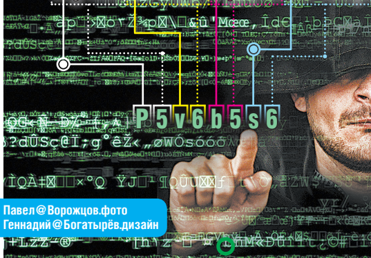
Геннадий @Богатырёв.дизайн

Например, возьмём книгу Д.Р.П. Толкина «The Hobbit, or There and Back Again». 198g126v86N – вот такой пароль получился благодаря известному произведению.